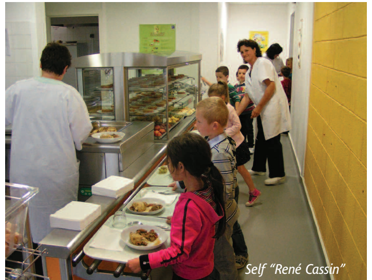
Self "René Cassin"

Le coût global hors taxe de l'opération s'élève à 220 000 €.