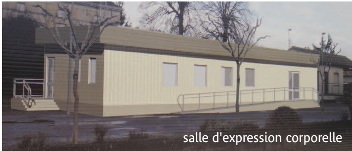
salle d'expression corporelle

En lieu et place de l'ancien préfabriqué les travaux de la salle de danse et de gymnastique ont commencé début juillet pour une livraison prévue fin octobre (le planning initial sera respecté). Ce bâtiment qui comprend une salle d'évolution de 145 m 2 , 2 vestiaires et des sanitaires adaptés, sera mis à disposition des associations « Modern'Jazz », « Gymnastique Volontaire » et « Karaté Club » qui sont, pour l'heure et jusqu'à la fin des travaux, hébergées dans une salle louée à cet effet par la commune.