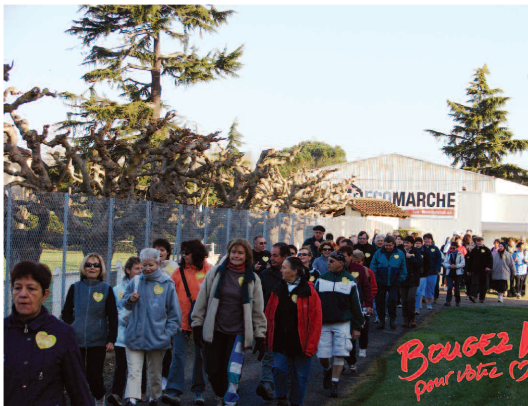
Les marcheurs au départ...